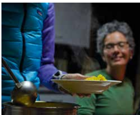
Etappenziel erreicht – Zeit für einen währschaften Znacht und gemütliches Beisammensein in der Hütte.

wollten sie der Gruppe eine Einlage spendieren. «Wir liessen alles fallen und schnappten Feldstecher und Fotoapparat – das war ein magischer Moment!» Oder als eine Frau sich nichts sehnlicher wünschte, als endlich einmal Steinböcke zu sehen. «Ich wusste, wo sie sich aufhielten und dass sie vom Hüttenwart mit Salz angelockt wurden. Und tatsächlich trafen wir auf eine ganze Gruppe mit Jungtieren, die übermütig «gumpten» und rangelten – wir konnten den Blick kaum von ihnen lösen.» Das Stauen einer Gruppe über die riesige Pflanzenvielfalt im Binntal oder das Glück jenes Mannes, der sich mit dem Aufstieg zur Glarner Planurahütte auf 2947 Metern über Meer einen Lebenstraum erfüllte, bleiben unvergessen. «Das verbindet», formuliert es die erfahrene Bergführerin. Kein Wunder, hat sie inzwischen viele Stammgäste, darunter ganze Gruppen. Und trotzdem – die Leute, die sie sicher über Schnee, Stock und Stein führt, sind während der Tour Gäste, keine Kollegen. «Meine erste Aufgabe ist und bleibt die Sicherheit und die professionelle Füh-